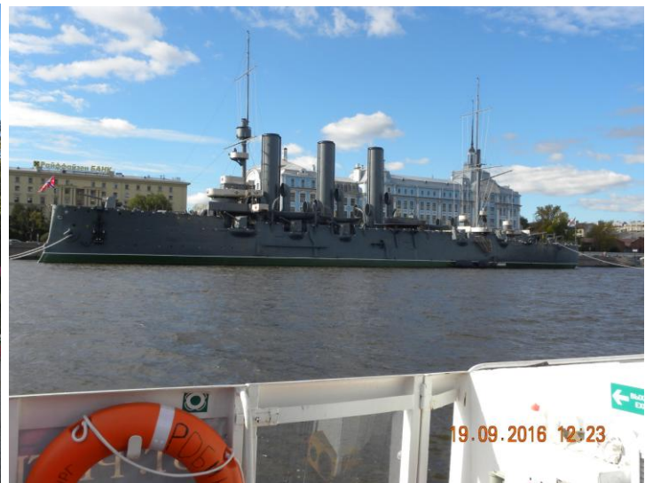
20. září 2016 – den v partnerské škole, otevírání mostů, balet